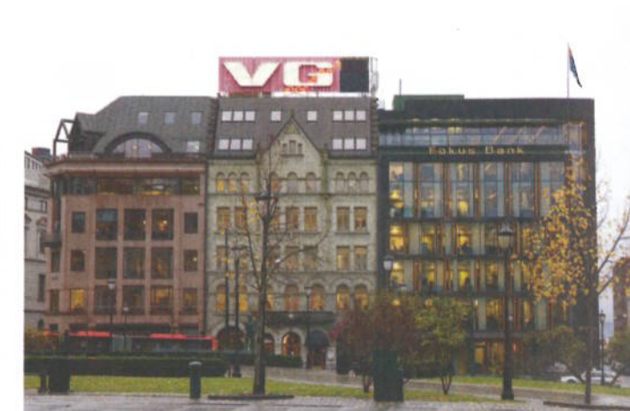
The white building og The black building kaller Kristin Jarmund de to sentrumsbygningene på Tjuvholmen (t.v.) og i Stortingsgata (t.h.).